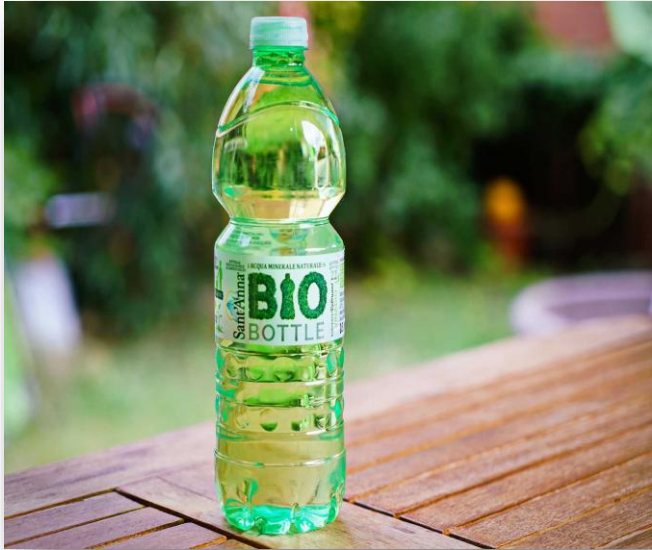
Beleidsmix voor de PET-keten in transitie | Planbureau voor de Leefomgeving

PL 1.1 Stimulerende wet- en regelgeving,