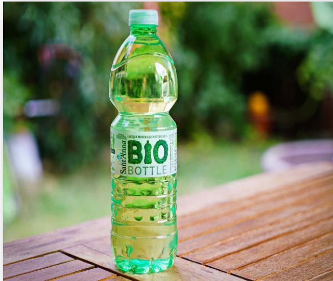
Beleidsmix voor de PET-keten in transitie | Planbureau voor de Leefomgeving